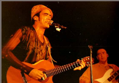
Marzo 1996.

Como otros grandes de la música su carrera acabó de forma prematura en Agosto del 97.